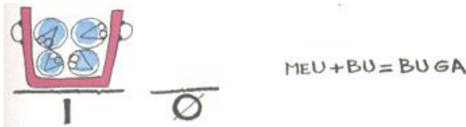
FIGURE 2 – Calcul Shadok

Dans ce cas il existe une solution très simple, on les jette dans une poubelle, et on dit : j'ai BU poubelle. Et pour ne pas confondre avec le BU du début, je dis qu'il n'y a pas de Shadok à côté de la poubelle et j'écris BU GA (figure 2).